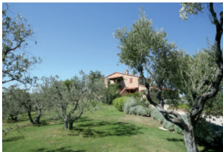
L'Azienda Agricola Pomario in provincia di Orvieto, vista, vini arale e sariano