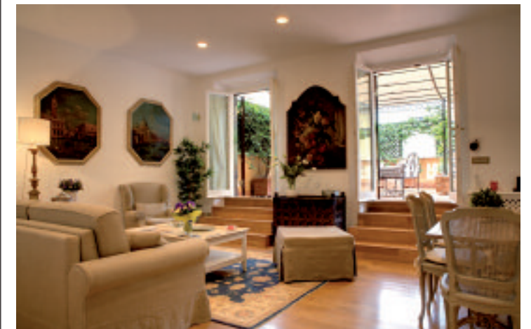
Villa Spalletti Trivelli, Nuove graden Suite, staff completo, vista esterna

Una ricerca di armonia che si ritrova anche in altre scelte della famiglia Spalletti Trivelli, una su tutte la tenuta agricola di Pomario. «Esisteva già una passione della famiglia per i vini», ci racconta il conte Giangiaco- mo Spalletti, «ricordo con calore l'idea di coltivare un prodotto no-